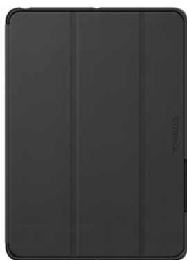
Funda otterbox Simetry Folio

Máxima protección a base de materiales de alta calidad,