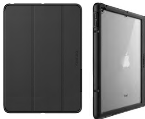
Funda otterbox Simetry Folio

Máxima protección a base de materiales de alta calidad,