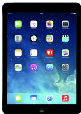
iPad 32 Gb wifi

Impresionante Pantalla 9,7 pulgadas, chip A10 64 bits Apple, cámara FaceTime HD