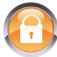
Seguro 3 años

Seguro de 3 años contra rotura, caída de líquidos y robo que protege el iPad ante cualquier percance.