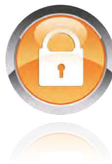
Seguro 3 años

Seguro de 3 años contra rotura, caída de líquidos y robo que protege el iPad ante cualquier percance.